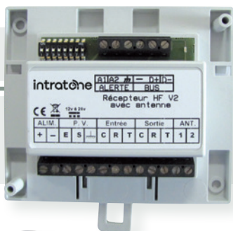
07-0101 HF-ontvanger met verplaatste antenne (mogelijk om een 2 e toe te voegen) - Plaatsing in een elektrische tabel - Real time