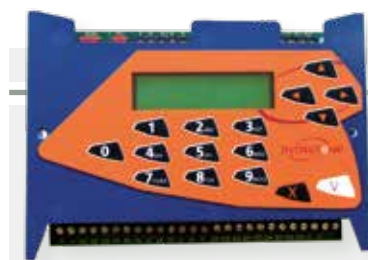
03-0101 : Centrale de gestion 2 portes et/ou 1 000 noms en temps réel